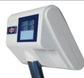
Retro testa bilancia