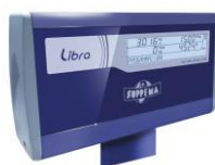
Retro testa bilancia