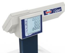
Display cliente 4 righe