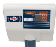
Retro testa bilancia