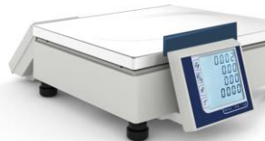
Modello CS basso