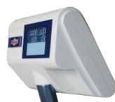
Retro testa bilancia