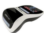
Collegabilità a tutte le gamme Ditronetwork