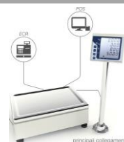
Collegamento ECR o POS