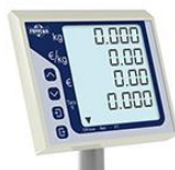
Display operatore / cliente 4 righe