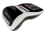
Collegabilità a tutte le gamme Ditronetwork