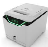
Collegabilità a tutte le gamme Ditronetwork